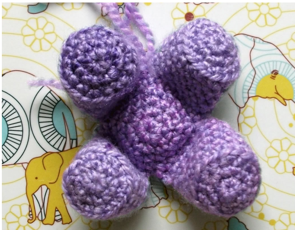
Fig 2: Onderkant van de buik met poten