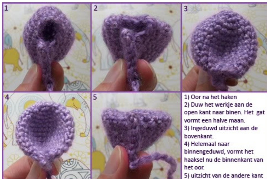
Fig 6: Hoe het oor te vormen (@Charami)