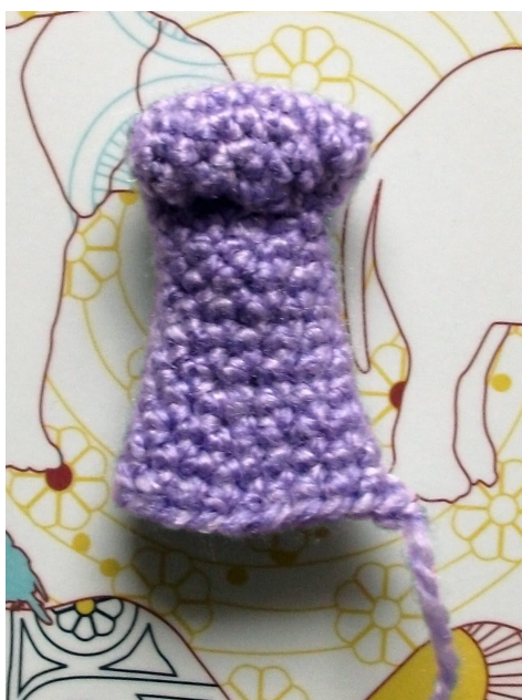
Fig 4 (links): Onderkant van slurf