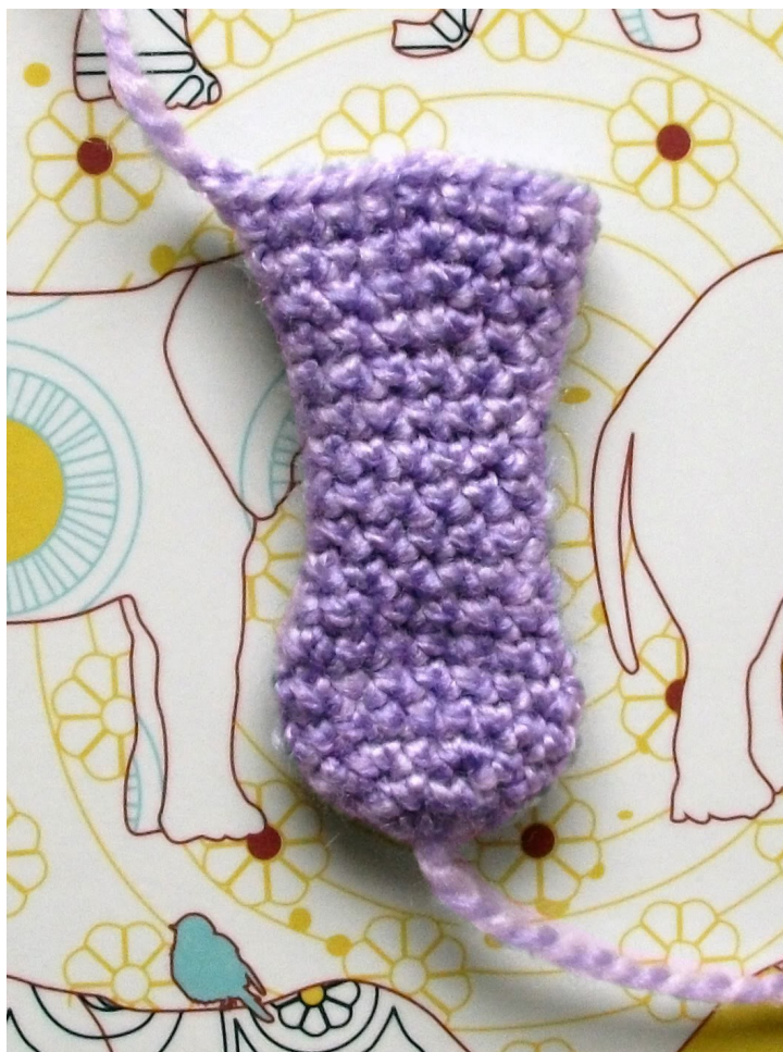
Fig 3: Platgedrukte slurf voor het oprollen