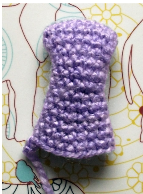
Fig 5 (rechts): Bovenkant van slurf (© Charami )